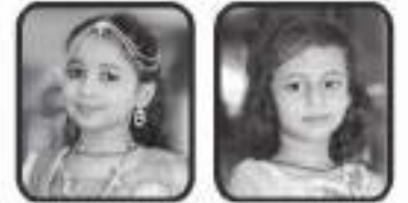
કુ. દ્રષ્ટિ કુ. ચશા

ખાસ નોંધ : પહેડીના લાભાર્થી પરિવાર તરફથી નિયાણી બહેનો માટે સ્પે. લક્કી ડ્રો રાખેલ છે. તેમના પ્રભાવનાના કવર ઉપર નંબર છાપેલ છે તે લક્કી ડ્રો માટે છે. માટે કવર છેલ્લે સુધી સાચવવા વિનંતી.