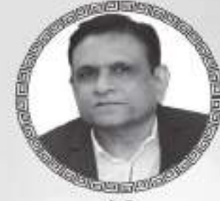
મંત્રી શ્રી જીતેન્દ્ર જીવરાજ કારીઆ - કકરવા